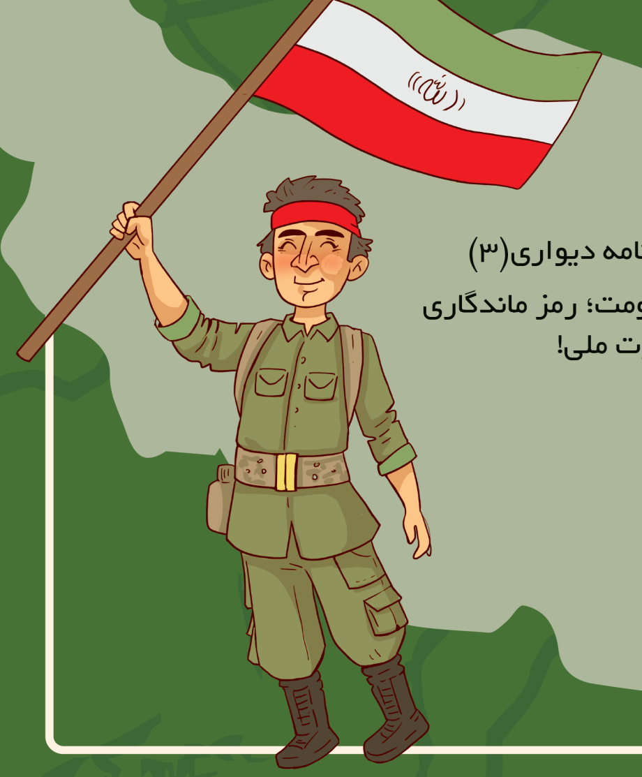
روزنامه دیواری (۳) مقاومت؛ رمز ماندگاری و عزت ملی!

وقتی ایستادگی، از هزار تا سازش با ارزش تره! تو تاریخ، ملت‌ها همیشه سر دو راهی بودن: یکی راه راحت ولی سربلند مقاومت، اونایی که عقب کشیدن، کم‌کم استقلالشون رو دادن، وابسته شدن و حتی بخش‌هایی از خاک و غرورشونو از دست دادن. ولی ملت‌هایی که گفتن نه! تازه خودشونو پیدا کردن. ایران تو جنگ هشت ساله‌ی تحمیلی دقیقاً همین کار رو کرد؛ با ایمان و اتحاد، جلوی دنیایی از فشار ایستاد و نداشت حتی یه وجب از خاکش بره. نتیجه؟ نه فقط حفظ مرزها، بلکه ساختن اعتمادبه‌نفس به نسل بود. مقاومت یعنی یکی سختی رو تحمل می‌کنم، ولی هویت و کشورم رو نمی‌فروشم!